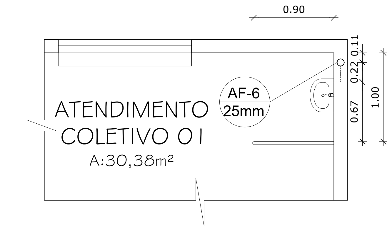
PLANTA BAIXA AF-6 1/25